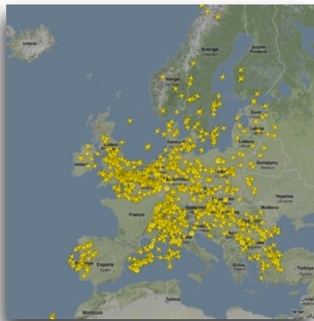
Luftverkehr über Europa normal (links) und über Zentraleuropa während der Vulkanasche-Panik April 2010 (rechts). Und der Himmel über meinem Kopf: makellos blau, ohne Kondensstreifen (oben).

Zeit, Geduld und der Wichtigkeit des eigenen Tuns zu entwickeln. Und sich zu fragen, welche Alternativen es zu den ursprünglichen Plänen und den längst verinnerlichten Ansprüchen gibt.