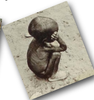
Kleinkinder in Europa (Tchibo-Werbung), Asien (Hilfsprojekt), Afrika (Hunger-Bericht)