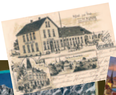
Ob SMS oder Postkarte – den Damen braucht man. Entweder zum Schreiben der Nachricht oder zum Halten der Postkarte beim Lesen. Übrigens ist die Postkarte mit ihren Nachrichten mit Abstand nach wie vor das beliebteste Medium, sich aus dem Urlaub zu melden.

Sollte es umgekehrt kommen, bedarf es keiner Fachleute mehr. Es gibt falsche Texte – falsch geschrieben, falsch dargestellt, falsch arrangiert, falsch gedruckt. Aber es gibt (oho!) keine falschen Bilder – höchstens schlecht reproduzierte und gedruckte. Warum? >